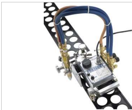
S jedným strojným rezacím horákom