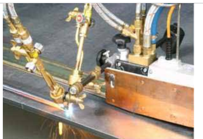
S dvoma strojnými rezacími horákmi